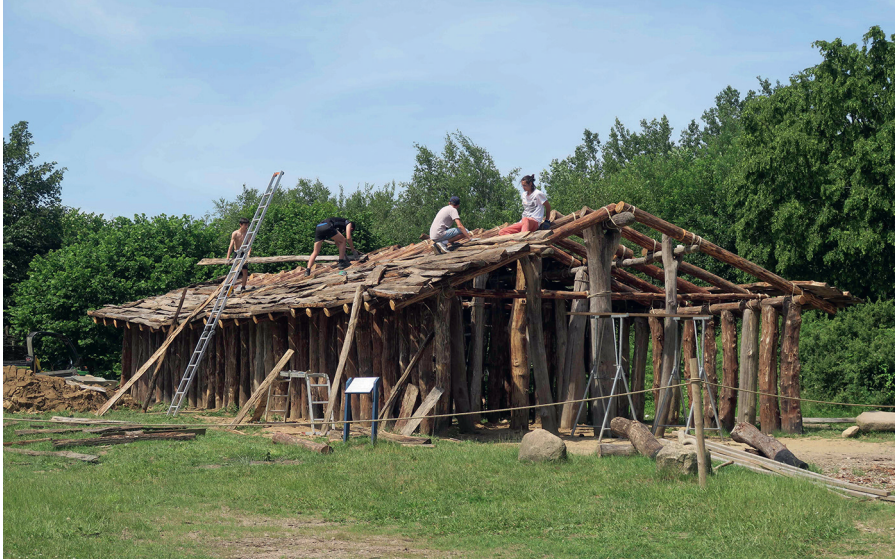
Abb. 6. Im Rahmen eines zweiwöchigen internationalen Jugendworkcamps wurde das Modell eines Steinzeithauses im Albersdorfer Steinzeitpark wieder instand gesetzt, vor allem durch den Bau von Lehmwänden und durch Dachdeckungsarbeiten.