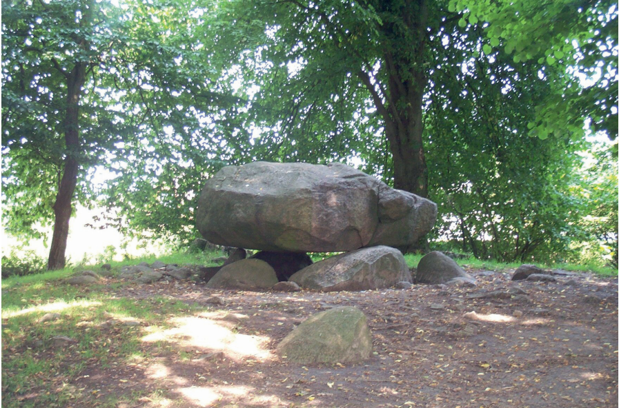
Abb. 1. Der »Brutkamp« in Albersdorf besitzt mit seinen knapp 23 Tonnen Gewicht den größten Deckstein eines Großsteingrabes in Schleswig-Holstein. Fig. 1. The megalith »Brutkamp« in Albersdorf has a capstone weighing c. 23 tons and is the largest capstone in Schleswig-Holstein.

die Bedeutung dieser aus dem Bretonischen entlehnten Begriffe sind nicht abschließend geklärt. Als Menhire gelten einzelstehende hohe Steine oder Steinblöcke, als Cromlechs Steinkreise und als Dolmen solche Steinsetzungen, die aus einem aufliegenden großen Stein und dessen Steinbasis bestehen. Daneben gibt es »Alignements« (Französisch für »gerade Reihe«) genannte Steinreihen.